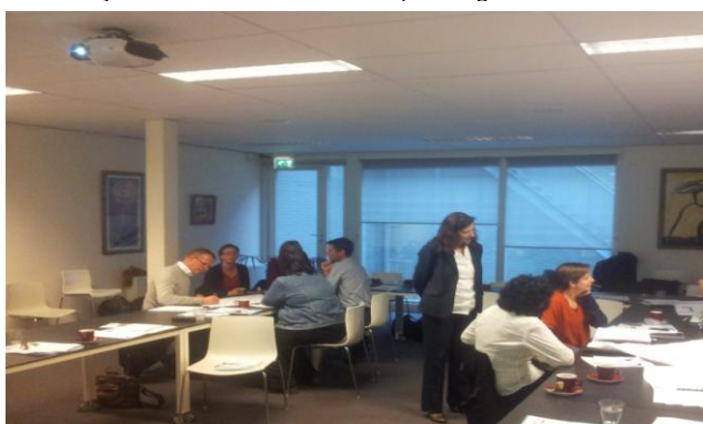
Themabijeenkomst over discriminatie op de stage- en arbeidsmarkt