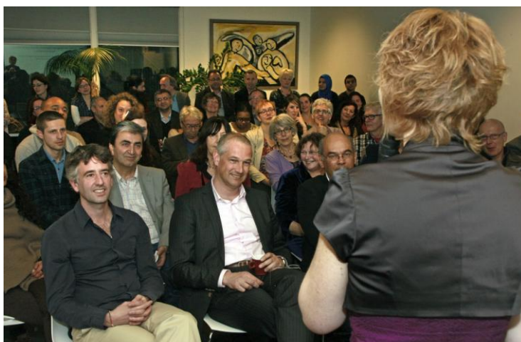
Themabijeenkomst op 21 maart; Internationale dag tegen Racisme en Discriminatie