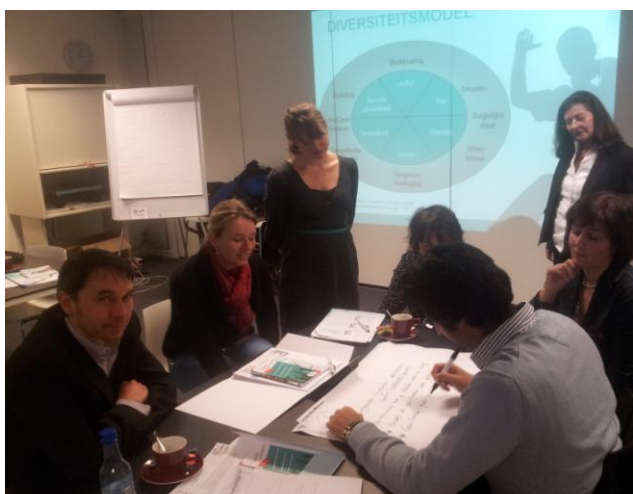
Themabijeenkomst over discriminatie op de stage- en arbeidsmarkt

In opdracht van Art.1 MN hebben een aantal studenten een afstudeeronderzoek uitgevoerd. Zo is er onderzoek gedaan naar het opleggen van sancties bij discriminatie en ongelijke behandeling. Hieruit is een leidraad uit voortgekomen, die gebruikt kan worden door Art.1 MN bij het geven van advies aan de cliënt om schadevergoeding te vorderen. Er heeft ook een onderzoek plaatsgevonden naar de effectiviteit van de methode van Art.1 MN om vacatures te screenen op discriminerende functie-eisen en deze aan te schrijven. Deze methode bleek niet effectief en is daarom afgeschaft. In 2012 is er ook een onderzoek gestart naar het VN-verdrag inzake de rechten van personen met een handicap in relatie tot het beleid van gemeente Amersfoort. Aan de hand van de resultaten hoopt Art.1 MN de gemeente Amersfoort een advies te kunnen geven over de eventuele aanpassingen waartoe het verdrag leidt.